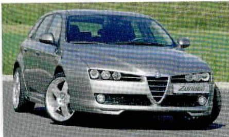
Zender-Alfa 159 auf großen 19-Zoll-Füßen

Zubehörspezialist Zender (Telefon 02 61/28 63 33) hat sich seit jeher der Marke Alfa Romeo verschrieben. Somit kommt das umfangreiche Veredelungsprogramm für die Kombi-Version des 159 also nicht von ungefähr. Optisch wird der edle Italiener durch eine markante Frontschürze (350 Euro), Seitenschweller (269 Euro) sowie eine Heckschürze (350 Euro) und schicke 19-Zoll-Räder (Stück 239 Euro) weiter in Szene gesetzt.