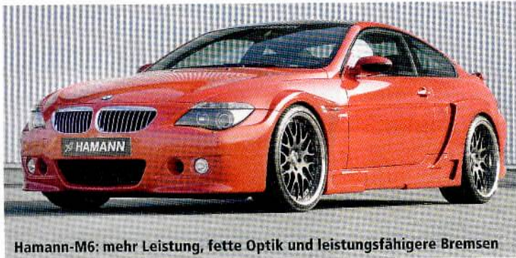
Hamann-M6: mehr Leistung, fette Optik und leistungsfähigere Bremsen

Zurückhaltung ist beim M6 Edition Race von Hamann (Tel. 0 73 92/9 73 20) nicht gefragt. Der Breitbau-BMW setzt auf den maximalen Auftritt – mit dicken Backen, wuchtigen Schürzen und bis zu 21 Zoll großen Schmiedefelgen. Dank einer Modifikation des Motor-Steuergeräts und dem Einsatz einer anderen Auspuffanlage inklusive Sportkatalysatoren soll der Edition Race 567 PS leisten und über 300 km/h schnell sein.